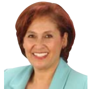
Adriana Muñoz D'albora, Senadora

Hemos llamado a la Ministra de Educación a rectificar y terminar con esta política de abandono. Chile requiere una Nueva Educación Pública que recoja las enormes potencialidades de las comunidades escolares y las proyecte hacia adelante.