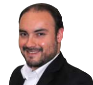
Alcalde de Coquimbo, Marcelo Pereira

Todos los equipos municipales continuarán trabajando arduamente, porque sabemos lo importante que es para nuestras familias morar en una vivienda digna, segura y que supla las necesidades básicas. Haremos todo lo posible para que esto se cumpla se la manera más eficiente e inmediata.