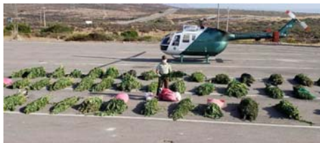
En Cavilólén, Coahuila

«Sin duda que criticar al Gobierno Regional, dispararle, siendo que a menos de 48 horas de este terremoto ya teníamos al Presidente de la República en una visita de emergencia a la región, incluyendo a los ministros de Vivienda y de la Cultura. Desde ese punto de vista, vimos a todo el Go-bierno Regional y a los seremis desplegados en toda la región, así que hay que hacer un reconocimiento, porque nosotros lo vimos inmediatamente ocurrida la emergencia. Los vimos desplegados, recorriendo las zonas más afectadas, por lo tanto criticar al gobierno regional siendo que no tiene ningún asidero».