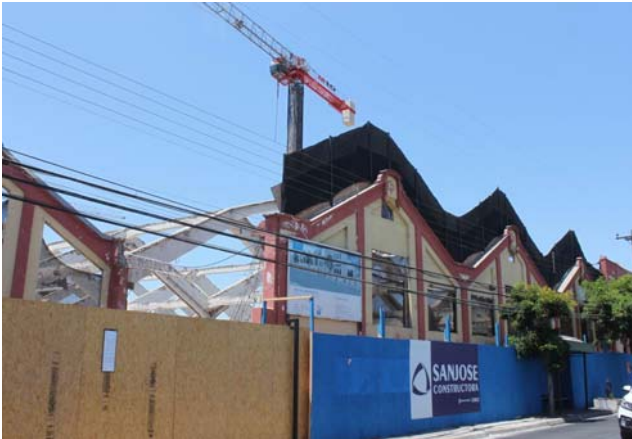
Edificio de los tribunales de justicia, en la ex planta embotelladora de Pisco Control, en calle Rengifo.

Actualmente hay en construcción al menos 5 edificios que se ubicarán en el centro de La Serena, sin considerar el nuevo edificio consistorial de La Serena, que pronto comenzará su construcción, que en total suman más de 62 mil metros cuadrados y una inversión superior a los 162 mil millones de pesos.