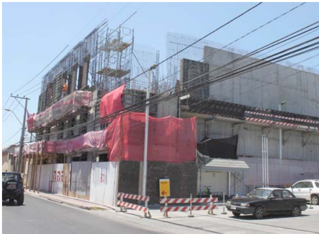
En calle Brasil con Balmaceda, otro edificio Rencoret.

En las nuevas dependencias funcionarán el Juzgado de Familia La Serena, el Juzgado de letras del trabajo y el 1°, 2° y 3° Juzgado de letras de La