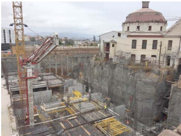
Construcción del nuevo CDT, en terrenos de la ex cárcel de La Serena.