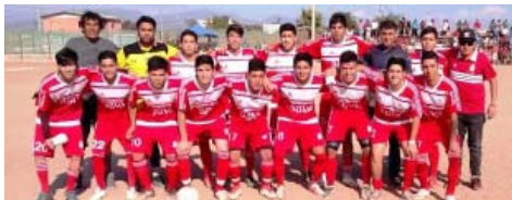
HURACÁN, Campeón Asofútbol Andacollo, avanzó a la II Fase Torneo de Clubes Campeones 39 Versión.

Los restantes partidos válidos por los encuentros de IDA de la II Fase del torneo en su 39 versión, serán: