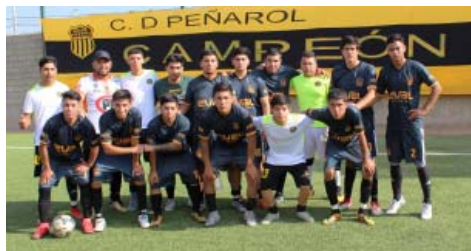
PEÑAROL, Vice de Asofútbol Serena Norte avanzó a la II Fase de la 39 versión Torneo Regional de Clubes Campeones 2019.

En caso de clasificar Unión Arzobispal, este el domingo a las 14.00 horas en el Complejo Luis Amenábar Carvallo recibe a Unión Español, por el IDA de la II Fase. En la otra cara de la medalla, de ganar Halcones Negros, este el domingo recibirá en el Estadio La Pampilla, pasto sintético, 16.00 horas a Unión Español.