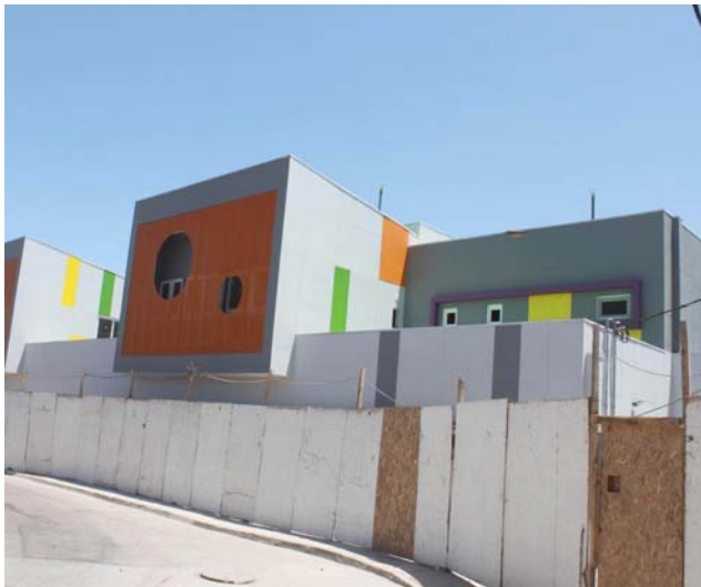
Jardín infantil borde Río, en calle Cirujano Videla con Los Carrera.