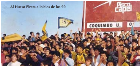
Al Hueso Pirata a inicios de los 90

Años más tarde cuando Coquimbo Unido jugaba su primer torneo en la división de honor, el año 1963, la prensa de la época menciona que en el partido jugado frente a Colo Colo en el puerto, la barra de Coquimbo llamada «Los Machueleros» apoyaba sin cesar a su equipo. Haciéndose notar entre las más de diez mil personas