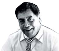
En Mi Rincón Por Gonzalo Tapia Díaz

Usted decide en este momento, al leer mi columna, si a las doce concurre a la cita que ya ha concertado con Lucifer. Yo no asistiría.