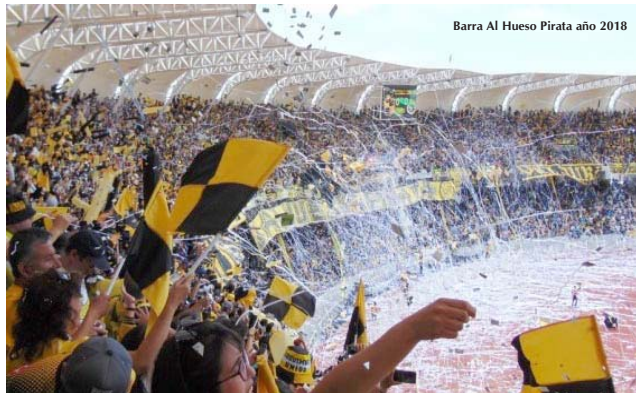
Barra Al Hueso Pirata año 2018

Autor del Libro Historia de Coquimbo Unido