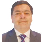
Juan Manuel Fuenzalida Diputado

No debemos perder el foco. Condena absoluta a la participación de narcos en los partidos políticos. No debemos descuidar a nuestros vecinos en las poblaciones, pero además debemos trabajar todas las instituciones para que eviten el ingreso de este flagelo en quienes llevan los destinos de las comunas y el país.