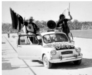
Pirata Pailoto año 1977

Desde que el fútbol llegó a Coquimbo a fines del siglo XIX, el hincha porteño ha llamado la atención a lo largo de Chile por su fanatismo, pasión y arraigo con su tierra, no por nada los buques ingleses que llegaban al puerto se sorprendían ante la cantidad de gente que iba a presenciar los partidos a la cancha del estanco para ver a los agueridos coquimbano.