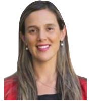
Daniela Norambuena Gobernadora Provincial de Elqui

El Gobierno Regional y municipios están haciendo entrega de lentes en forma gratuita para ver este fenómeno, debemos tener cuidado y seguir las recomendaciones del Seremi de Salud. Faltan escasos días y seguimos escabando para que todo salga lo mejor posible, ya que estaremos en los ojos de todo el mundo, seamos amables con el visitante y cuidemos nuestro entorno; tenemos un desafío y debemos cumplirlo a cabalidad porque Chile está en Marcha.