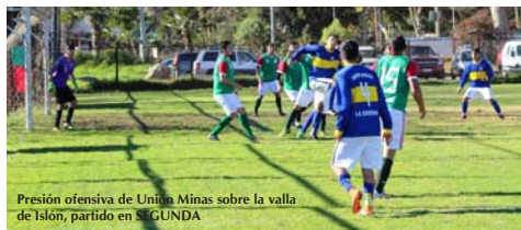
Presión ofensiva de Unión Minas sobre la valla de Islón, partido en SEGUNDA

10.00 y 11.45 horas. Cancha 1: Estudiantes Unidos v/s Sporting Bolívar. Cancha 2: Pedro Aguirre Cerda v/s Unión Morán. Cancha 3: Mermasol v/s Los Copihues. Cancha 4: Dinamo v/s Islón. Cancha 5: Alfalfares v/s Santo Domingo.