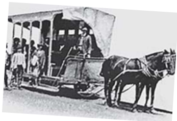
Ferrocarril Urbano de Coquimbo

Busqué el viernes en Guayacán algún descendiente de este grupo familiar y no encontré a nadie, solo recuerdos de este personaje coquimbanense perdido en el tiempo. (Próximo domingo, Parte 2 y final)