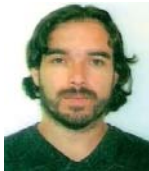
Por Felipe Fernández

Autor del Libro Historia de Coquimbo Unido